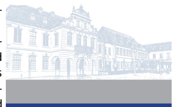
TILL kompakt 2018

Kommentierter Auszug aus der Bildungsdatenbank TILL - Trierer Informationssystem Lebenslanges Lernen mit dem Schwerpunkt Zuwanderung und Migration