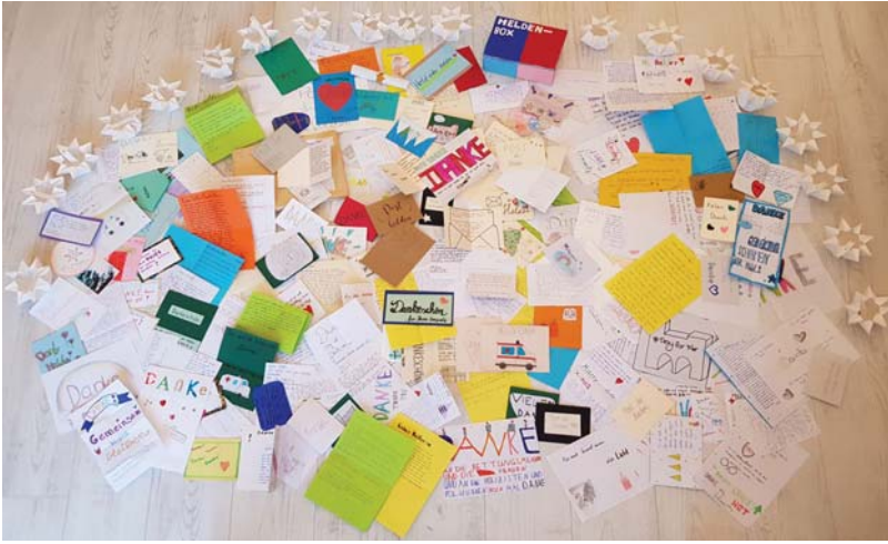
Bunt und kreativ. Zahlreiche Briefe mit Worten des Dankes gingen bei der Aktion „Heldenpost“ ein.