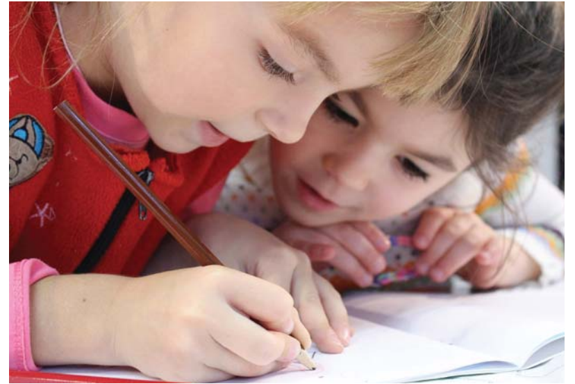
Fokussiert. Kinderschutz in Schulen mit einem Überblick über Unterstützungsmöglichkeiten standen im Fokus einer Fachtagung.