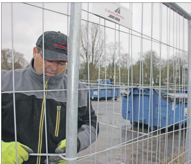
Sicherheit. Ein Mitarbeiter der Firma Schnorpfel stellt auf dem Parkplatz Spitzmühle einen Bauzaun um die Container auf, in denen die Erde lagert, die in Fässer umgefüllt und verbrannt wird.

gleichen Tag gemessen: Am 15. war es mit 13,3 Grad frühlinghaft mild und mit minus 3,4 Grad winterlich kalt. Die Durchschnittstemperatur im Februar lag mit 4,6 Grad knapp drei Grad über dem vieljährigen Mittel. Geregnet hat es mit 33,6 Millimetern knapp 40 Prozent weniger als sonst in diesem Monat. Seit Jahresbeginn hat es an 18 Tagen 55,2 Millimeter geregnet. Die Sonne schien 55 Stunden und damit knapp 20 Stunden weniger als sonst im Februar.