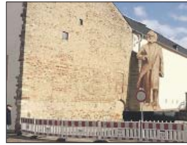
Probstellung der Marx-Statue im Bereich Margarethengäßchen/Simeonstiftplatz.

Die Schenkung der Marx-Statue des international anerkannten Künstlers Wu Weishan ist ein Akt der Wertschätzung der chinesischen Regierung gegenüber dem Geburtsort des Philosophen. Diese sollen wir nicht nur annehmen, weil es die Höflichkeit erfordert. Nein, ein gutes Miteinander gibt uns auch die Grundlage, miteinander ins Gespräch zu kommen. Viele Chinesen, die 2018 nach Trier kommen, werden mit einer Jubiläumsausstellung kon-