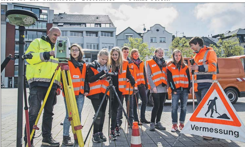
Genauer Blick. Einblicke in die Vermessungstechnik erhielten die Mädchen beim Girls‘ Day 2016 durch Mitarbeiter des städtischen Amtes für Bodenmanagement und Geoinformation.