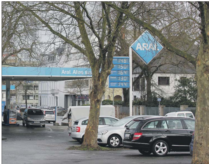
„Blaue Lagune“. Die Tankstelle in der Ostallee bleibt umstritten.

Die Premiere des Schauspiels „Der Steppenwolf“ am vergangenen Sonntag im Luxemburger Theater war nach Angaben von OB Wolfram Leibe ein großer Erfolg: „Das Haus war nahezu ausverkauft.“ Besonders freute sich der OB über die Ankündigung des Intendanten des Luxemburger Grand Théâtre, Tom Leick-Burns, die Kooperation mit dem Trierer Theater fortführen zu wollen. Die Inszenierung ist eine Koproduktion des Trierer und des Luxemburger Theaters.