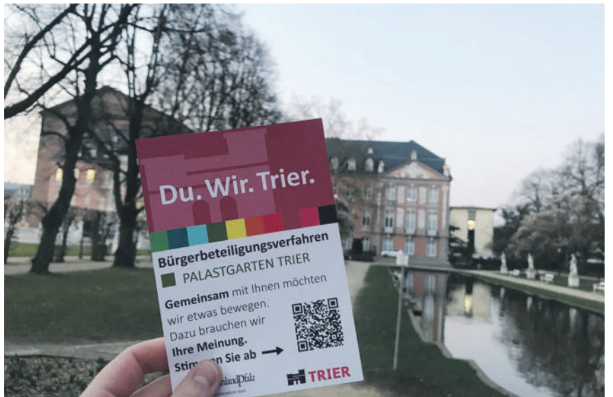
Oase und Angstraum. In der Dämmerung wirkt das Wasserband mit dem Kurfürstlichen Palais im Hintergrund malerisch, doch in der Dunkelheit entstehen hier für viele Menschen Angststräume.

Nach einem 45-minütigen Rundgang mit intensiven Gesprächen in den