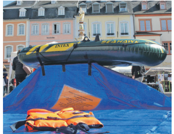
Anklage. Die AG Frieden und der Migrationsbeirat arbeiteten schon beim „Tag des Flüchtlings“ im Oktober 2021 zusammen. Eine Präsentation von Schlauchboot und Schwimmweste auf dem Hauptmarkt sollte zeigen, wie gefährlich etwa eine Flucht über das Mittelmeer sein kann.

Ergänzend ist in der Galerie die Schaufensterausstellung „Gemeinsam gegen Antisemitismus“ des Vereins „Für ein buntes Trier – gemeinsam gegen Rechts“ zu sehen. Weitere Details: www.agf-trier.de . red