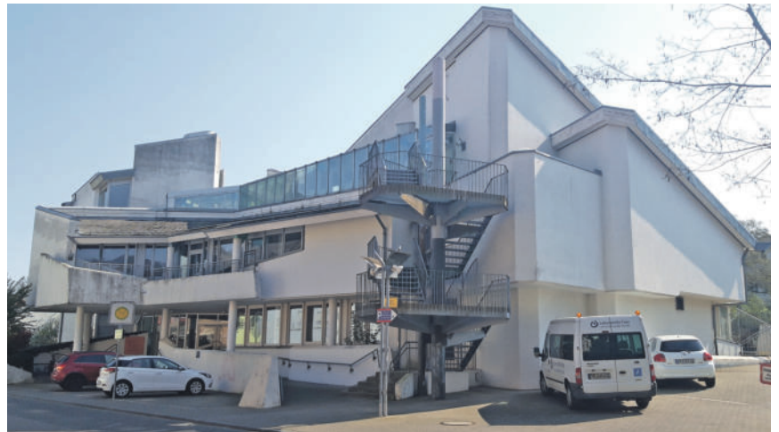
Unikat. Das in der zweiten Hälfte der 80er Jahre errichtete Gebäude der Porta Nigra-Schule in der Engelstraße unterscheidet sich in seiner expressiven Architektur deutlich von anderen Schulimmobilien. Seit August 2020 befindet es sich in städtischer Trägerschaft.

Schulträgersausschuss diskutiert Perspektiven für sanierungsbedürftige Porta Nigra-Förderschule