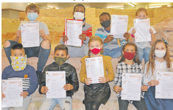
Mit Urkunde. Die erste Generation der Stipendiaten, hier beim feierlichen Start des Programms in den Viehmarktthermen im September 2020, hat zahlreiche Bildungs- und Beratungsangebote durchlaufen.

Die geänderten Förderbedingungen der Kreditanstalt für Wiederaufbau (KfW) haben keine Folgen für städtische Bauprojekte, da nach Angaben des Hochbauamts derzeit keine Projekte mit KfW-Förderung abgewickelt werden. Dies geht aus der Antwort von Baudezernent Andreas Ludwig auf eine CDU-Anfrage im Stadtrat hervor. Im Januar hatte Bundeswirtschaftsminister Robert Habeck einen Stopp für mehrere KfW-Förderprogramme für energieeffiziente Gebäude verhängt. Er wurde zum Teil zwischenzeitlich wieder zurückgenommen – dennoch war und ist die Verunsicherung bei Bauherren groß.