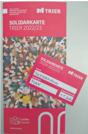
Relaunch. Die Trierer Solidarkarte 2022 präsentiert sich im neuen Design und mit Braille-Aufdruck.

Berechtigte erhalten die Solidarkarte über das Amt für Soziales und Wohnen oder das Jobcenter. Die Nutzerzahlen