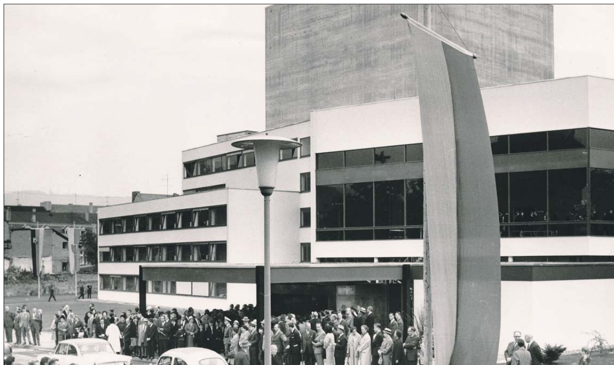
Vor 51 Jahren. Beim Festakt zur Einweihung des neuen Baus 1964 bildeten viele Neugierige ein Spalier am Eingang des neuen Stadttheaters. Heute ist unklar, wie es mit dem zwischenzeitlich maroden Bau weitergeht.

Eine Alternative zum Neubau am Augustinerhof könnten zwei Theaterstandorte sein. Dies bedeutet: Sanierung und Umbau des Gebäudes am Augustinerhof und der Neubau eines kleineren Hauses an einem anderen Standort. Zur Überprüfung dieser „Zwei-Standort-Strategie“ wird laut Egger ein Statiker beauftragt, der neben der Statik des gut 50 Jahre alten Gebäudes auch die Bausubstanz überprüfen soll. „Er wird Analysen machen und sagen, was geht und was nicht geht“, erläuterte der Dezernent. Zwei bis drei Monate seien für diese Untersuchungen eingeplant. Parallel dazu werde hinsichtlich des Raum-