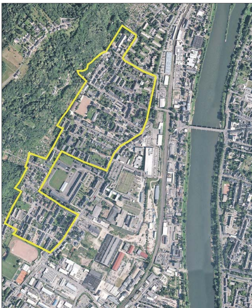
Vogelperspektive. Das Fördergebiet Soziale Stadt in Trier-West/Pallien (gelbe Umrandung) liegt westlich der Eurener und der Hornstraße. Wichtigste Verbindung zur Innenstadt auf der anderen Moselseite ist die Römerbrücke.