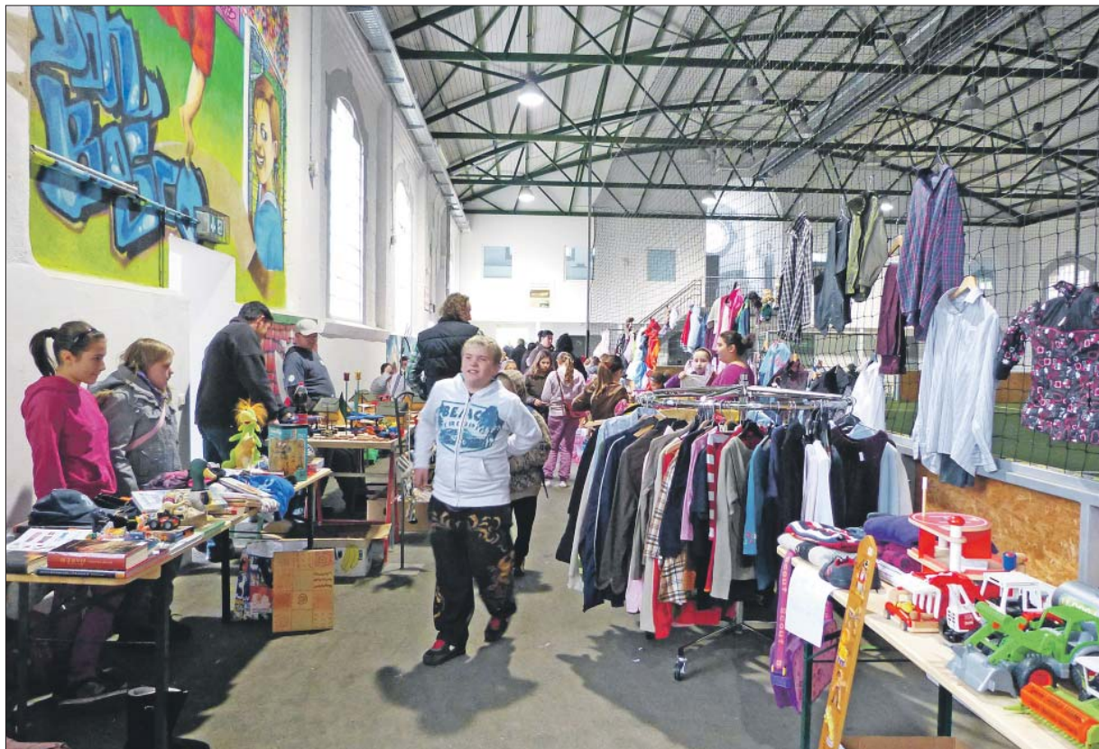
Treffpunkt. Die Don-Bosco-Soccerhalle wird nicht nur als Sportstätte, sondern auch für Flohmärkte (Foto) und ähnliche Stadtteilveranstaltungen genutzt.

Den Leitfadens für das Programm Soziale Stadt bildet seit 2009 das Integrierte Handlungs- und Entwicklungskonzept (IHEK). Darin wurden unter Berücksichtigung von Bürgerinteressen Maßnahmen für Trier-West festgelegt, die zur Aufwertung des Stadtteils und zur Verbesserung der Lebenssituation der Bevölkerung vor Ort beitragen sollen. Dabei fungiert das seit 2005 bestehende Quartiersmanagement in Trägerschaft des Caritasverbands Trier als Bindeglied zwischen dem Rathaus und den Bewohnern und Akteuren vor Ort und