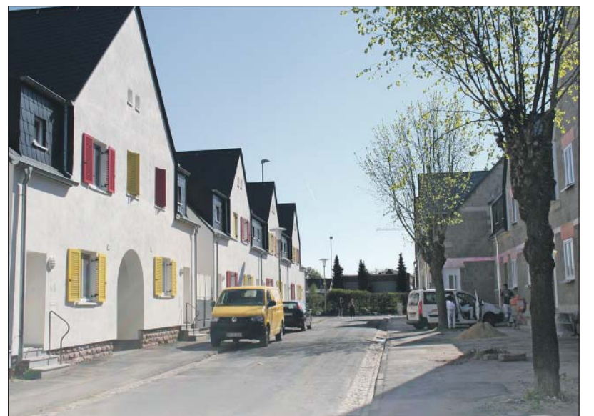
Aufwertung. Wohnhäuser der Siedlung Im Schanzenbungert wurden mit Fördergeldern der Sozialen Stadt von Grund auf saniert.