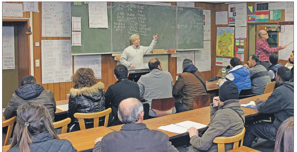
Mit Musik. Von zentraler Bedeutung für die Integration von Flüchtlingen ist das Erlernen der deutschen Sprache, was in diesem Musikprojekt in der ehemaligen General-von-Seidel-Kaserne auch berücksichtigt wurde.

In diesen Stadtteilen steckt viel Dynamik: Trier-West, -Nord und Ehrang präsentieren sich am Samstag, 9. Mai, mit einem vielfältigen Aktionsprogramm zum bundesweiten Tag der Städtebauförderung. Rundgänge, Ausstellungen und Diskussionen bringen den Besuchern von 10 bis 18 Uhr die aktuellen und geplanten Projekte der städtebaulichen Sanierung und sozialen Integration nahe. Natürlich stehen auch Mitmachangebote für Kinder auf dem Programm, es gibt kostenlose Imbissangebote. Treffpunkte sind das Bürgerhaus in der Franz-Georg-Straße für die Soziale Stadt Trier-Nord, das Bürgerhaus in der Niederstraße für die Soziale Stadt Ehrang, die Halle Bauspielplatz I im Trierweilerweg für die Soziale Stadt Trier-West und die Jägerkaserne in der Eurener Straße für das Stadtumbaugebiet Trier-West. Zur künftigen Nutzung der Jägerkaserne