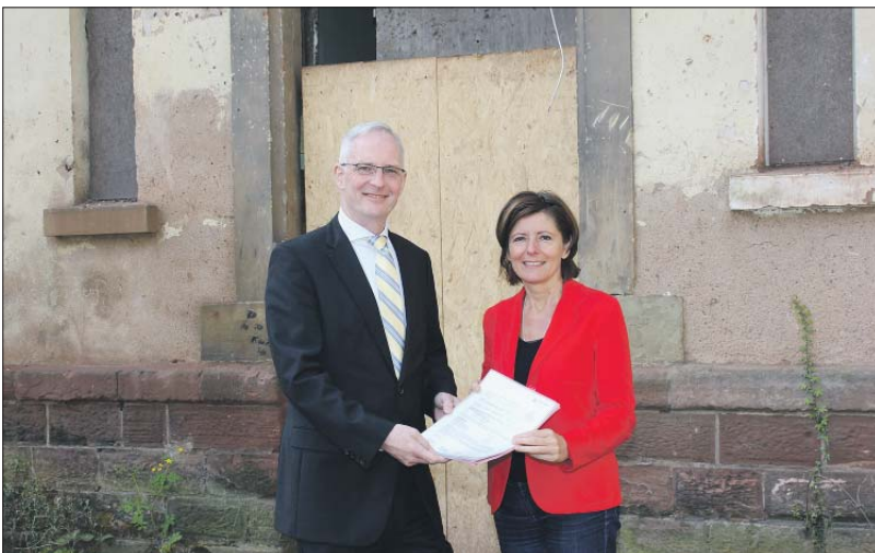
Ortstermin. Im Hinterhof des maroden Gebäudekomplexes Gneisenaustraße 33-37 überreicht Ministerpräsidentin Malu Dreyer einen der Förderbescheide an Oberbürgermeister Wolfram Leibe.

Die Höchstbeiträge für Familien stellen sich seit Januar wie folgt dar: Für Kinder unter zwei Jahren in Ganztagsbetreuung stiegen sie von 352 auf 546 Euro, für Kinder unter zwei Jahren in Teilzeitbetreuung von 297 auf 382 Euro und für Kinder im Schulalter (Hort) von 263 auf 382 Euro.