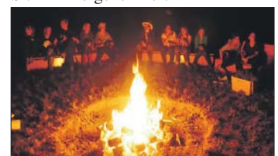
Ein Lagerfeuer darf natürlich nicht fehlen.

Seit Jahrzehnten ist das Pfingstzeltlager in Ernzen nahe der luxemburgischen Grenze fester Bestandteil der Ferienangebote des Mergener Hofes. Kinder von sechs bis zwölf Jahren können vom 22. bis 26. Mai das Lagerleben kennenlernen, am Feuer sitzen und viel Spaß mit anderen Kindern haben. Freiheit, Natur und Aktion sorgen für ein unvergessliches Ferienerlebnis, bei dem die Teilnehmer neue Freunde finden und mit ihnen zu einer großen Gemeinschaft zusammenwachsen. Im Gedenken an den heiligen Willibrod nehmen die Kinder an der Echternacher Springprozession teil. Daher ist eine Schulbefreiung für den 26. Mai notwendig. Veranstalter des Zeltlagers in Ernzen ist der Jugendverband der Gemeinschaft christlichen Lebens im Bistum Trier mit Sitz im Mergener Hof.