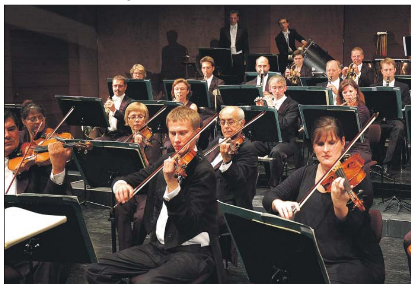
Mit Violine. Das Philharmonische Orchester der Stadt Trier absolviert jährlich über 100 Auftritte im Bereich Oper, Operette, Musical, Ballett sowie im Rahmen von Sinfonie- und Sonderkonzerten.

■ Sonntag, 8. Mai 2016: Family Classics II