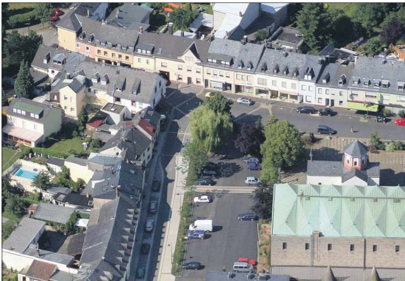
Eigentümerwechsel. Das Immobilienforum ist vor allem gedacht für Interessenten, die ein Bestandsgebäude verkaufen oder erwerben wollen. Bei der Preisermittlung spielt der Standort, wie auf diesem Luftbild der alte Heiligkreuzer Ortskern, eine wichtige Rolle.