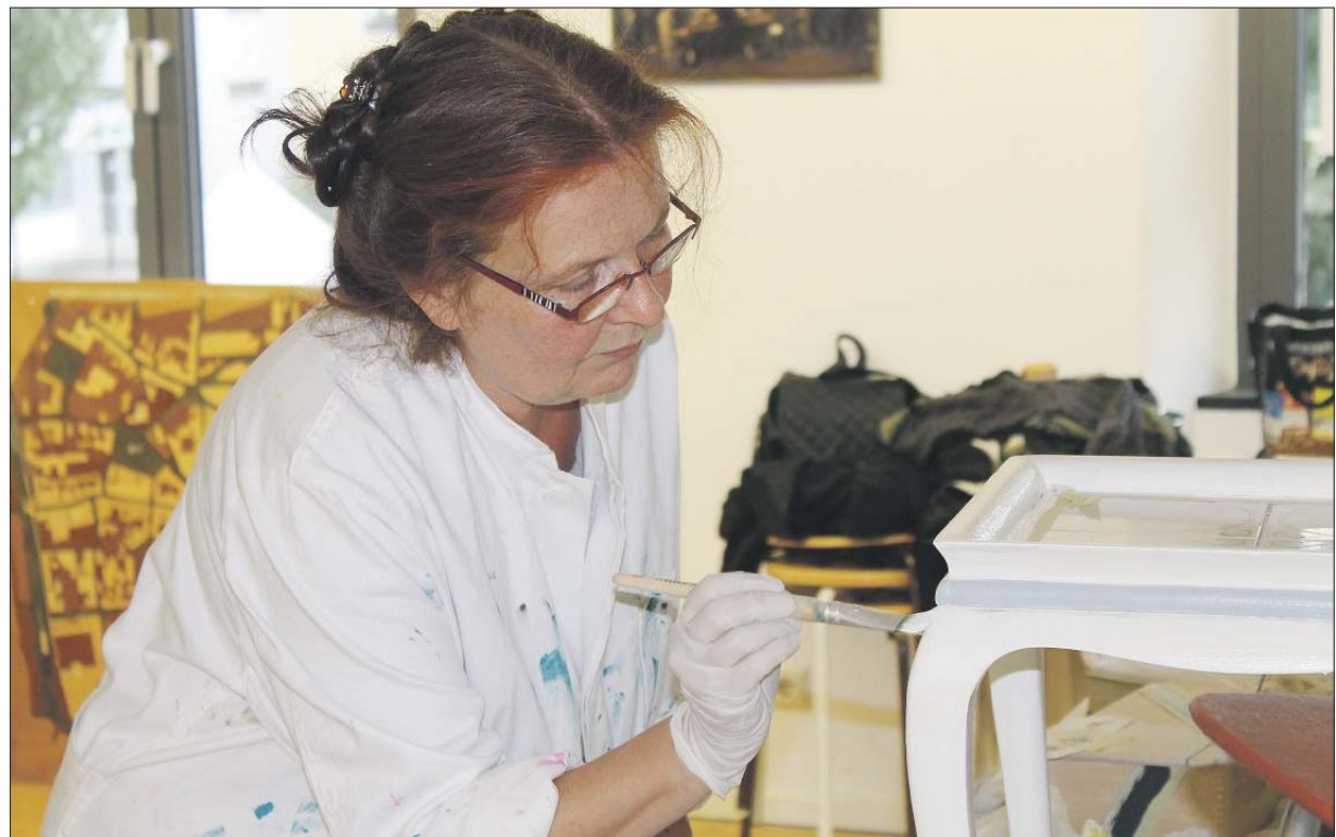
Werkstatt. Das Stadtmuseum beteiligte sich an der Premiere des Zukunftsdiploms für Erwachsene im letzten Jahr mit dem Workshop „Pimp my Möbel“. Diesmal sind zwei Veranstaltungen zum Thema Restaurierung geplant.

Alle Angaben ohne Gewähr/Stand: 18. Mai 2016