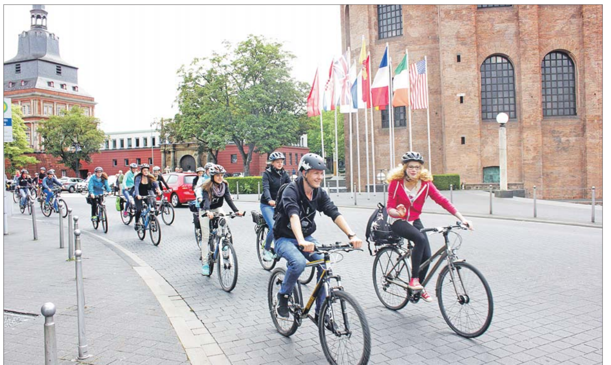
Gruppendynamik. Gemeinsame Touren der Teams, wie hier bei der Eröffnungsfahrt 2015, bringen besonders viele Kilometer auf das Trierer Konto beim Stadtradeln.

Der Wettbewerb wird vom Klimabündnis, dem europäischen Städtenezwerk zum Klimaschutz, organisiert. Gesucht werden Deutschlands fahradaktivstes Kommunalparlament und die Kommunen mit den meisten Radkilometern – absolut und pro Kopf. Neben dem Wettstreit mit anderen Städten ist für Ludwig, der selbst gerne mit dem Rad zur Arbeit fährt, das Ziel der Aktion klar: „Wir wollen den Radverkehr in unserer Stadt weiter voranbringen und viele Bürgerin-