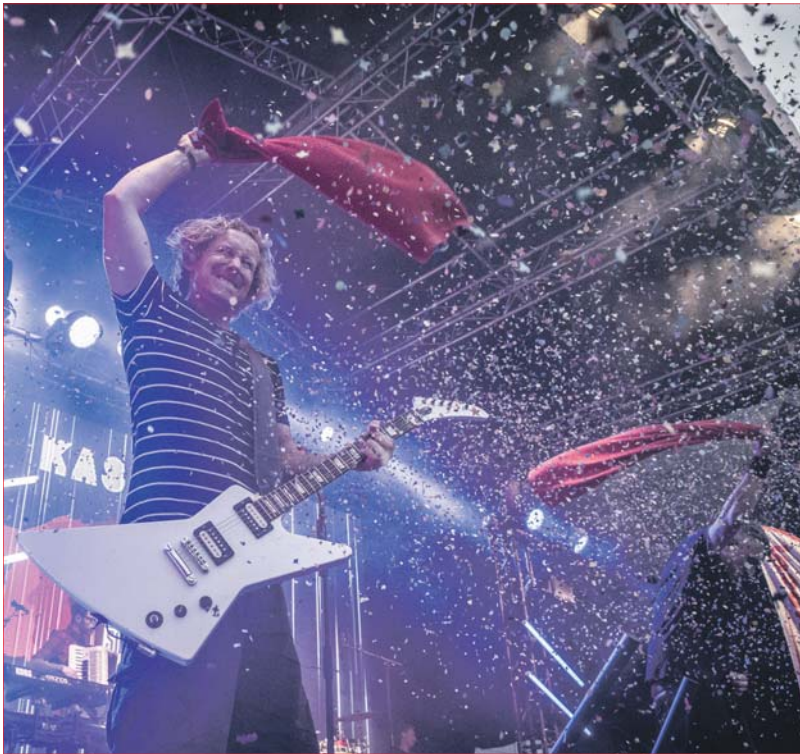
Klassiker. Live-Konzerte zwischen Porta und Viehmarkt – mit diesem Rezept behauptet sich das Altstadtfest seit 40 Jahren. Das Konzept wird ständig weiterentwickelt. 2019 rückt die Werbung in den Fokus.

Gestaltungswettbewerb für Plakate und Flyer für das Altstadtfest / Einsendeschluss am 15. Februar