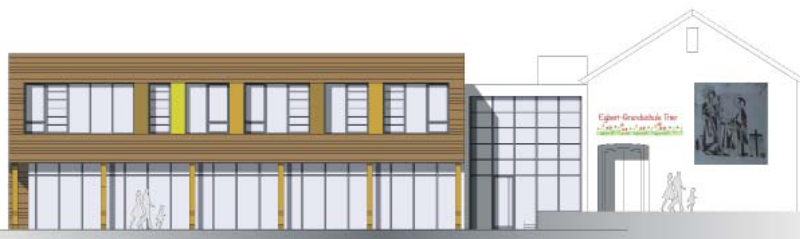
Kontraste. Der Entwurf des Andernacher Büros Rumpf zeigt aus der südlichen Perspektive einen rechten Teil, der dem heutigen Zustand ähnelt. Der linke mit den Klassenräumen und der Mensa im Erdgeschoss erhält eine moderne Hülle.

OB Leibe legt Wert auf die Unterscheidung zwischen Graffiti-Kunst und Schmierereien. Für die kreative Sprayer-Szene hat die Stadt in der Vergangenheit legale Flächen in Unterführungen und an der Konrad-Adenauer-Brücke freigegeben. Das Jugendamt steht in Kontakt mit den Künstlern und kann bei Bedarf weitere Flächen anfordern. kg