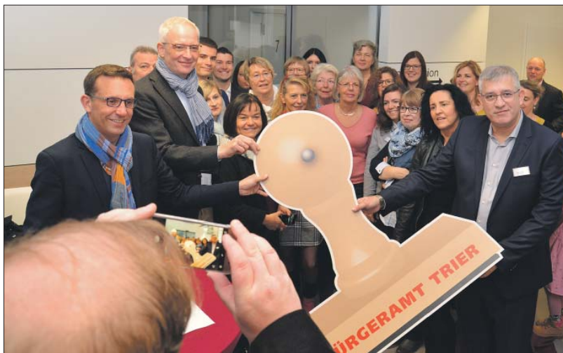
Bürgerfreundlich. Mitte Dezember wurde das umfassend sanierte Bürgeramt bei einem Tag der offenen Tür vorgestellt. Es bietet unter anderem einen kundenfreundlichen Wartebereich und deutliche Verbesserungen bei der Barrierefreiheit.

Die Innenraumverdichtung ist ein großes Thema. Wir verkaufen erstmals ein Grundstück an eine Wohnungsbaugesellschaft, die bezahlbares Wohnen in der Innenstadt realisieren soll. Wir wissen aber natürlich auch, dass Bürgerinnen und Bürger, die in der Nähe wohnen, nicht unbedingt begeistert sind. Manche haben etwa bislang ein freies Grundstück neben ihrem Haus und können einfach dort parken. Wenn es bebaut wird, fällt dieser Vorteil weg. Oder auf einem Trümmergrundstück ist in 70 Jahren ein schöner Baum gewachsen. Wie geht man damit um, dass er gefällt werden muss? Wir setzen uns auch mit solchen Themen auseinander. Ein wichtiges Projekt ist das Burgunderviertel, das die EGP zu zwei Dritteln gekauft hat. Im Moment stellt sie die Pläne für die Bebauung auf, um 2019 ins Genehmigungsverfahren gehen zu können. Dann steht die Jägerkaserne als großes Wohnbauprojekt an und die Seidel-Kaserne als Gewerbestandort. Man kann sagen, wir haben alles gekauft, was zu kaufen war: das frühere Polizeipräsidium als künftige Feuerwache, ein Drittel des Burgunderviertels und die frühere General-von-Seidel-Kaserne. Ich glaube, wir konnten die verfügbaren Grundstücksflächen im öffentlichen Interesse sichern. Positiv ist außerdem, dass es uns trotz dieser Ausgaben gelungen ist, die Haushaltsanierung fortzuführen.