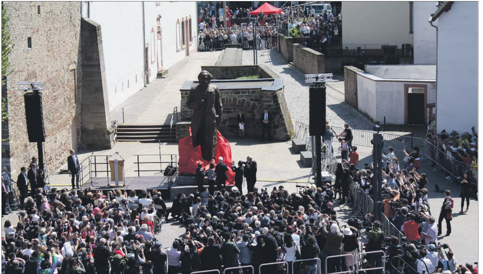
Großereignis. Rund 3500 Besucher und geladene Gäste sowie über 100 Journalisten aus der ganzen Welt erlebten am 5. Mai 2018 die spektakuläre Enthüllung der Karl-Marx-Statue auf dem Simeonstiftplatz.

Es läuft im Theater. Wenn ich sehe, dass sehr viele Vorstellungen ausverkauft sind und allein das Weihnachtsmärchen „Der Zauberer von Oz“ rund 20.000 verkaufte Tickets hat, bin ich optimistisch. Schulklassen, die in den letzten Jahren in andere Theater, bei-