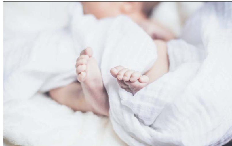
Willkommen. Die Vornamen Emma und Ben gefallen den frischgebackenen Eltern in Trier besonders gut: Sie wurden 2018 am häufigsten vergeben.

Platz fünf geht an Ella, Emilia und Lea (je 17 Nennungen). Charlotte, Marie und Mila landen mit je 15 Nennungen auf dem sechsten Rang. 14 Eltern haben ihre Tochter Greta genannt, womit sie auf dem siebten Platz landet. Rang acht teilen sich Amelie, Lina und Sophia (je 13 Nennungen). Der neunte Platz geht in dem Ranking 2018 an Johanna (zwölf) vor Ida, Klara und Romy mit je elf Nennungen. gut