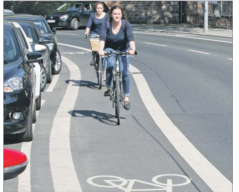
Freie Fahrt. Viele Teilnehmer forderten im Bürgerhaushalt, das Radwegenetz auszubauen. Durch neue zügige und sichere Verbindungen könnten auch mehr Autofahrer zum Umstieg auf das Rad bewegt werden.

Der höchstbewertete Vorschlag fordert einen schnellen Bau der bereits geplanten Kindertagesstätte St. Adula in Pfalzel. Von den 450 Bewertungen hierzu wurden 313 schriftlich eingereicht. Die Verwaltung merkte hierzu an, dass der Stadtrat die Entscheidung zum Baubeginn voraussichtlich im Frühjahr fällen wird. Der mehrfach geäußerte Wunsch, das Moselufer besser zu gestalten, ist ebenfalls bereits im Blickpunkt der Verwaltung, genauso wie die vielfach geforderte Verschönerung des Bahnhofsvorplatzes. Der Rat befürwortete zudem den Vorschlag, in der Nähe der Simeonstraße eine öffentliche barrierefreie Toilette bereitzustellen.