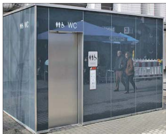
Örtchen. So oder so ähnlich wie auf diesem Beispielbild aus der Krebsgasse in Köln könnte die öffentliche Toilettenbox mit Behinderten-WC am Brunnenhof aussehen.

sowie das Stiftungs- und Vereinsrecht, aber auch die europäische Datenschutzgrundverordnung. Außerdem geht es um die Frage, wie die Vereine den dringend benötigten Nachwuchs vor allem für die zeitintensiven Führungs- und Vorstandspositionen gewinnen können. Die Trierer Auftaktveranstaltung am 2. Februar im Rathaus und im Theater eröffnet Ministerpräsidentin Malu Dreyer zusammen mit OB Leibe. Wegen der begrenzten Platzzahl werden Interessenten um rechtzeitige Anmeldung gebeten: wir-tun-was.rlp.de/de/veranstaltung/verein-und-ehrenamt/ anmeldung . red