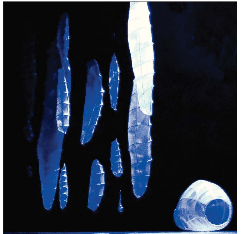
Unter dem Titel „Cocon“ präsentiert die Gesellschaft für Bildende Kunst Inszenierungen, Requisiten und Konzepte von Werner Bitzigeio. Die Ausstellung im Palais Walderdorff läuft noch bis 2. Februar. Foto: Werner Bitzigeio

„Schlaf gut, mein Kind“ , Klinikum Mutterhaus in Ehrang, 16 Uhr