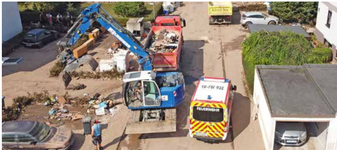
Bagger laden Unrat, den das Hochwasser in den Straßen Ehrangs hinterlassen hat, auf Lkws, die diesen zur Deponie fahren.