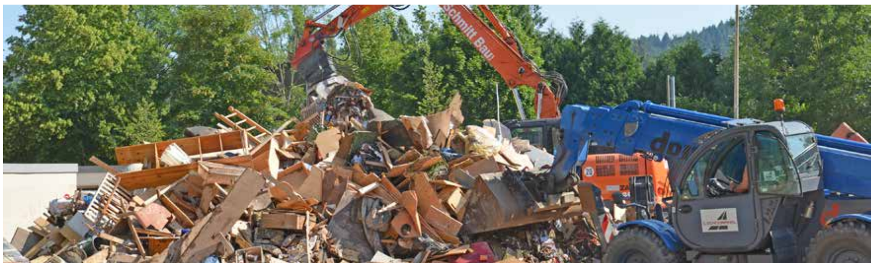
Mit schwerem Gerät wurden Schuttberge aufgehäuft und so für den Abtransport bereit gemacht.