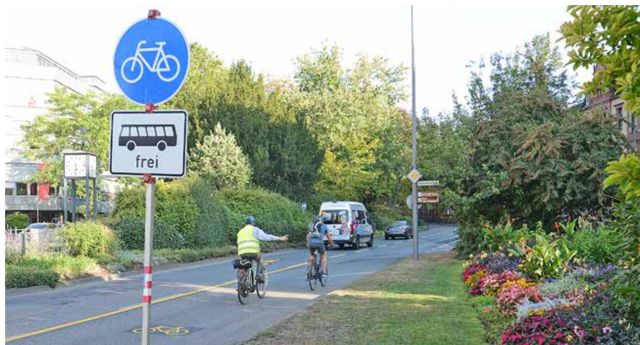
Aufgeteilte Fahrbahn. Die Umweltspur in der Christophstraße – hier während der Testphase im September 2020 – schafft mehr Platz und Sicherheit für den Fahrradverkehr.

Im Haushaltsjahr 2021 wird der Kita-Träger mit einem Betriebskostenzuschuss von rund 91.200 Euro gefördert. Der städtische Anteil liegt bei 48.720 Euro. Ab 2022 fallen dann jährliche Betriebskosten von voraussichtlich 182.400 Euro an. Der städtische Anteil beträgt dann jeweils 97.440 Euro.