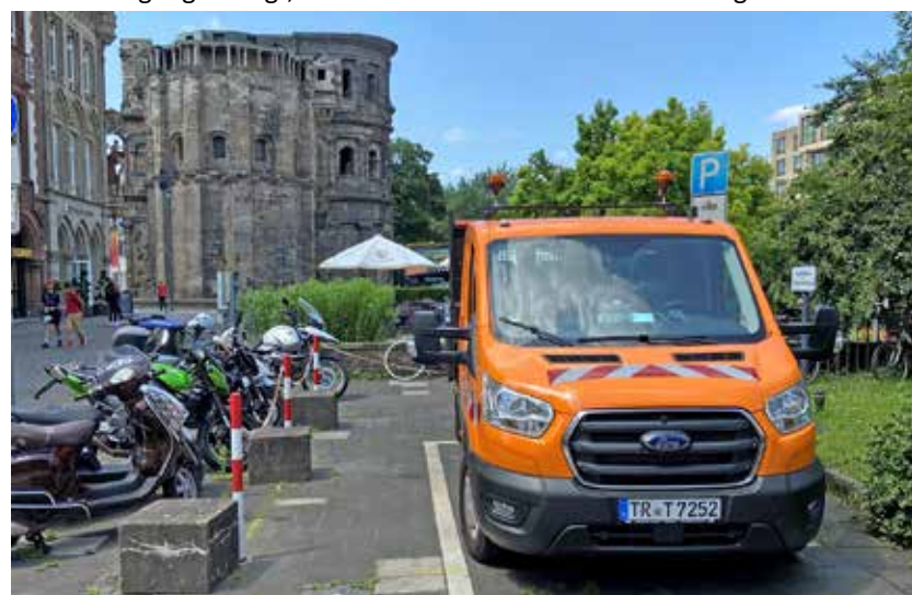
Nahe der Porta. An der Ecke Christophstraße/Rindertanzstraße, wo jetzt noch ein Fahrzeug der Stadtreinigung parkt, wird bald eine moderne, barrierefreie Toilettenanlage errichtet.

Der Besuch der Toilette wird einen Euro kosten. Ein Änderungsantrag der Linken, der unter anderem vorschlug, keine Gebühr zu verlangen, wurde vom Stadtrat – auch mit Blick auf die städtische Haushaltslage – abgelehnt. Menschen mit Behinderung, die einen Euro-Schlüssel besitzen, müssen nichts für die Nutzung zahlen. Begonnen wird mit dem Projekt, wenn der beantragte vorzeitige Baubeginn bewilligt ist.