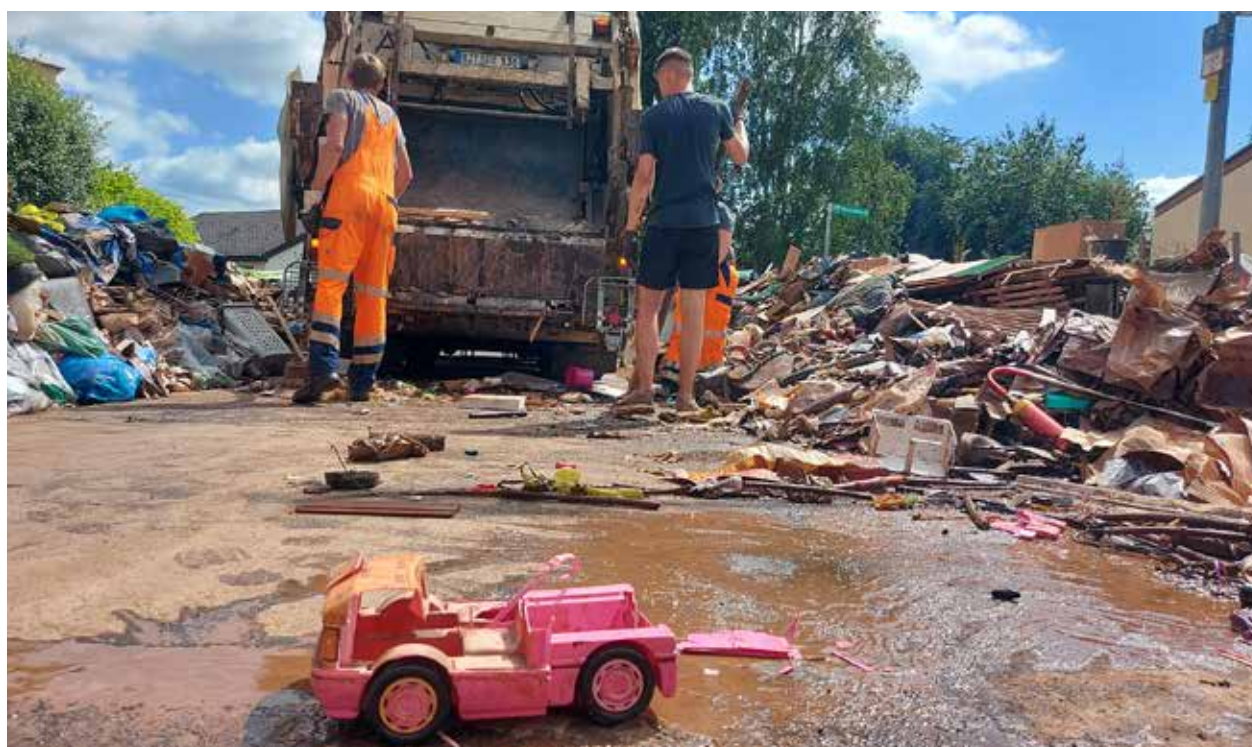
Vereinte Kräfte. Bei den Aufräumarbeiten in Ehrang packten neben StadtRaum und A.R.T. auch viele Freiwillige mit an, sodass der Stadtteil nach neun Tagen von dem Unrat, den das Hochwasser hinterlassen hat, befreit war.

Beim Aufsammeln des Sperrmülls aus einigen der engen Gassen in Ehrang sowie aus teils nur fußläufig erreichbaren Gebäuden packten auch viele Spontanhelferinnen und -helfer mit an. Bürgermeisterin Garbes: „Sich zu melden und einfach mit anzupacken, ist echtes bürgerschaftliches Engagement und zeigt erneut, dass