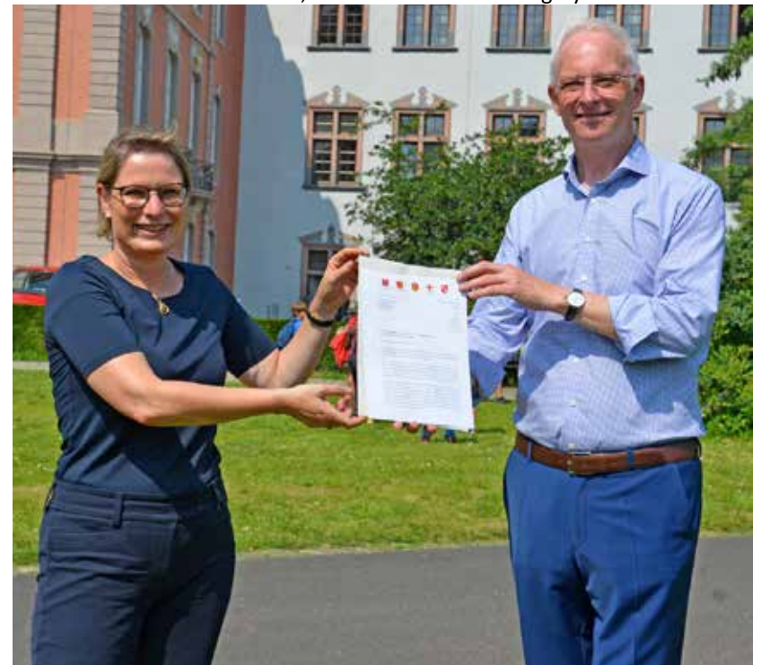
Schwarz auf weiß. OB Wolfram Leibe übergibt den gemeinsamen Brief, den er mit seinen OB-Kollegen und der OB-Kollegin verfasst hat, an Bildungsministerin Stefanie Hubig.

■ die verpflichtende Einrichtung eines Belüftungssystems.“ red