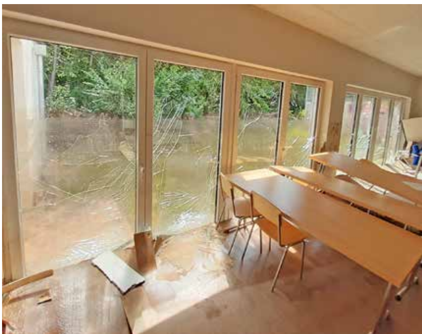
Bild der Zerstörung. Der erst vor wenigen Wochen neu eröffnete Jugendtreff in der Merowingerstraße ist von der Flut besonders stark betroffen: Das Wasser stand 1,50 Meter hoch im Erdgeschoss, der aufgeschwemmte Estrich muss ausgetauscht werden.

Schadensbilanz städtischer Gebäude in Ehrang / Jugendtreff, Grundschule St. Peter und Bürgerhaus besonders betroffen