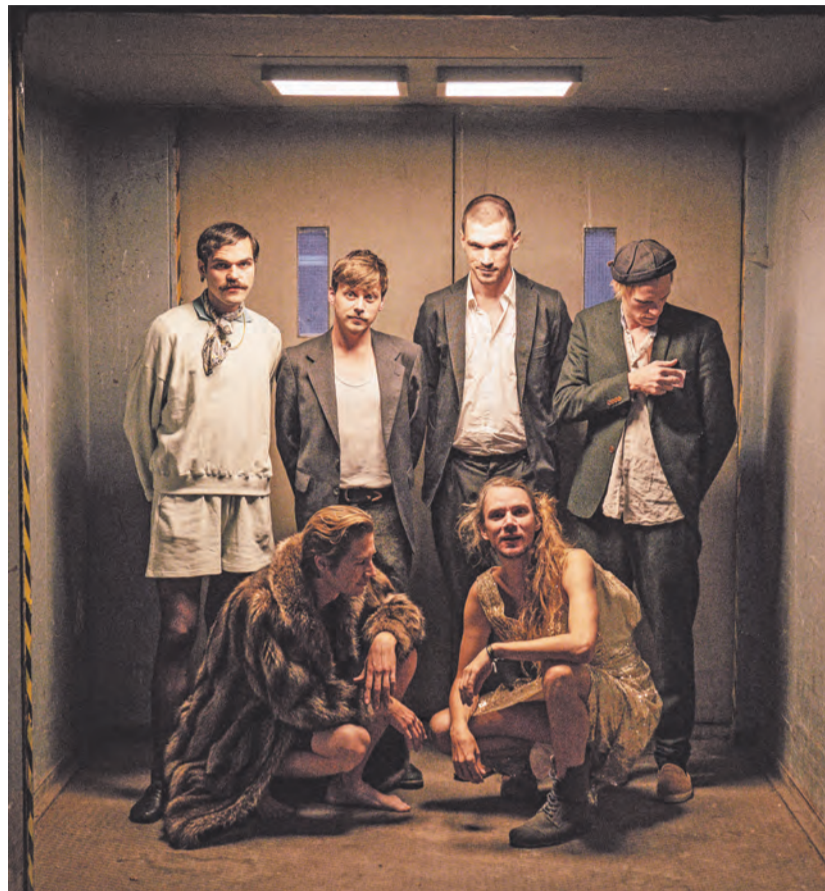
Auftakt. Am ersten Abend ist das Moselmusikfestival mit einem Konzert der Jazz-Band „Botticelli Baby“ zu Gast auf dem Teppich.

Freitag, 18. August: Mit einem rasanten Konzert eröffnet am Freitagabend um 20 Uhr die Band „Botticelli Baby“ den Flying Grass Carpet. Zum fetzigen Jazz-Punk der siebenköpfigen Truppe kann das Publikum