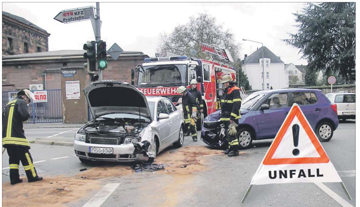
Umstellung. Die Missachtung des Ampelsignals ist eine häufige Unfallursache. Daher wurde an einigen Kreuzungen ein vergrößertes Rotlicht installiert und die Unfallzahlen gingen zurück.

Sehr erfreut zeigten sich die Experten, dass im Kreuzungsbereich Georg-Schmitt-Platz/Ascoli-Piceno-Straße die Zahl der Unfälle von 25 auf 21 zurückging. Sie hatten im Vor-