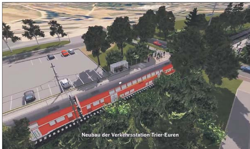
Neubau der Verkehrsstation Trier-Euren