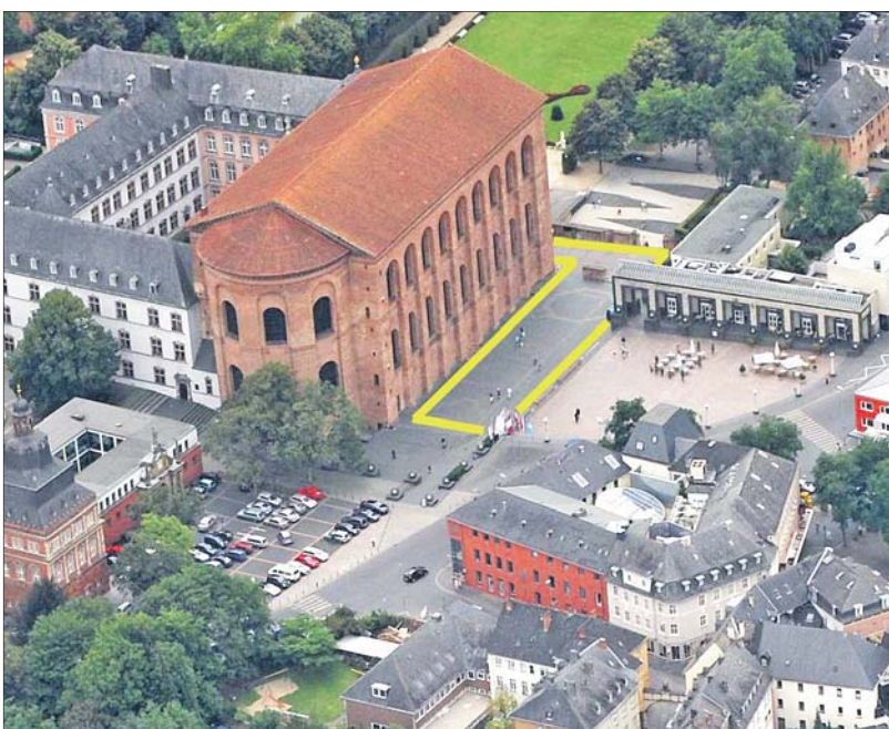
Vogelperspektive. Der neue Martin-Luther-Platz (gelbe Umrandung) umschließt die Konstantin-Basilika von zwei Seiten und bildet die unterste Ebene der abgestuften Fläche um das Welterbe.

Am Reformationstag, der am 31. Oktober begangen wird und 2017 bundesweiter Feiertag ist, lädt die Gemeinde zu einem Festgottesdienst in die Basilika mit anschließender Reformationsfeier auf dem Vorplatz. In diesem Rahmen ist auch die Einweihung des Martin-Luther-Platzes mit Enthüllung der Beschilderung geplant. Bei deren Gestaltung und Platzierung muss der Welterbestatus der Konstantin-Basilika berücksichtigt werden.