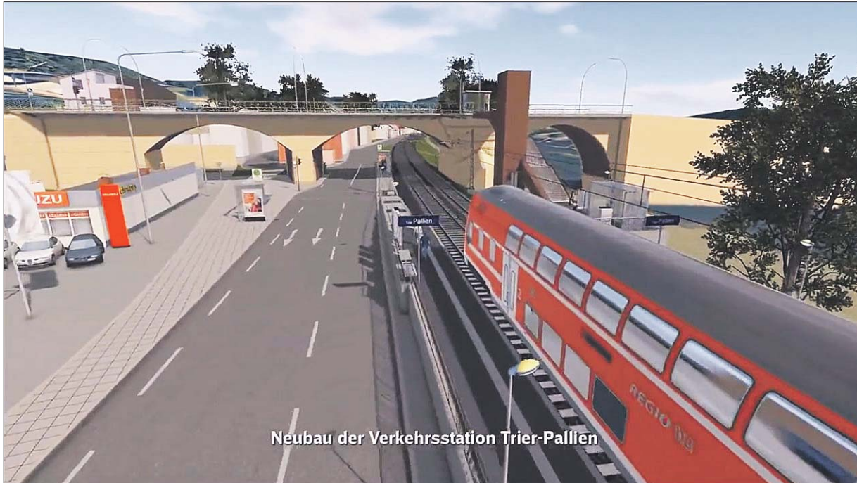
Neubau der Verkehrsstation Trier-Pallien