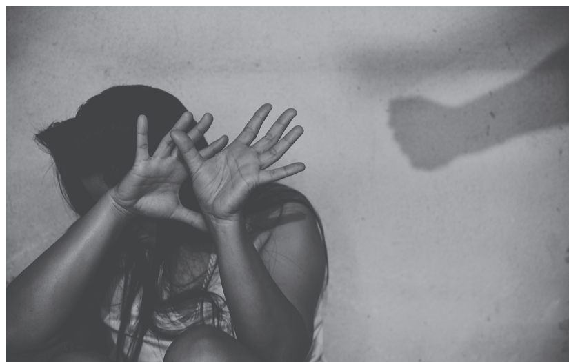
Ausgeliefert. In Trier verzeichnet die Polizei einen Anstieg von Gewaltstraftaten in engen sozialen Beziehungen.

Durch vielfältige Aktivitäten beteiligen sich in Trier Vereine, Geschäfte, die City-Initiative, die Polizei, das Theater, die Wissenschaftliche Bibliothek, das Stadtmuseum, die Sparkasse, die Volksbank und viele, viele mehr an der Kampagne „Orange the World“. Es wird sensibilisiert, aufgeklärt, angemahnt, unterstützt und demonstriert. Durch die Initiative des Zonta Club Trier und der Frauenbeauftragten der Stadt Trier werden an über 60 Orten in der Stadt orangefarbene Zeichen erkennbar sein. Im Foyer des Theaters wird ein orangefarbener Liegestuhl – als Spende des Zonta Clubs Trier – auf das bundesweite Hilfetelefon aufmerksam machen und so ein Zeichen für eine gewaltfreie Gesellschaft setzen können.