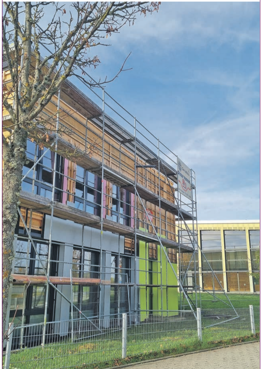
Die bereits laufende Erweiterung der Grundschule Tarforst um zwei Klassenräume durch eine Aufstockung des bereits vorhandenen Zusatzgebäudes (Foto vorn) wird rund 205.000 Euro teurer. Die Gesamtkosten liegen jetzt bei gut 970.000 Euro. Der Stadtrat billigte kürzlich den zusätzlichen Zuschuss. An der Grundschule Tarforst herrscht schon seit geraumer Zeit erhebliche Platznot. Daher hatte der Stadtrat im März 2020 eine Vergrößerung des Standorts durch ein Nebengebäude beschlossen. Der erneute Finanzbedarf hängt nun mit den deutlich gestiegenen Kosten für verschiedene Baumaterialien zusammen. Zudem gab es Probleme, überhaupt Firmen zu finden, die sich an den Ausschreibungen, vor allem bei den Holzbauarbeiten, beteiligen. Das führte zu einer weiteren Kostensteigerung.