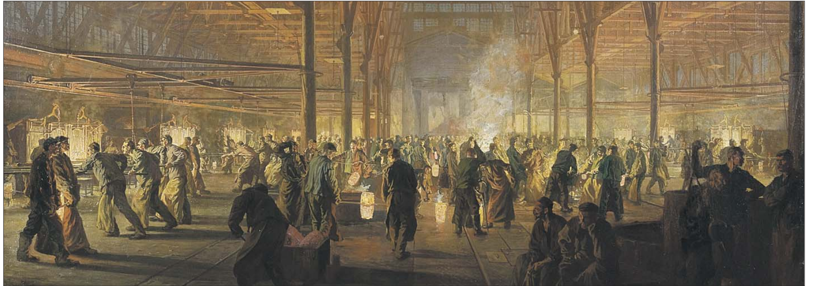
Panorama. Kohle und Stahl waren wichtige Triebkräfte der industriellen Revolution. Das Gemälde von Otto Bollhagen aus dem Jahr 1912 zeigt Arbeiter beim Tiegelstahlguß der Firma Krupp. Abbildung: Historisches Archiv Krupp, Essen

Viele Exponate der Marx-Ausstellung illustrieren die Umwälzung der Arbeitswelt im 19. Jahrhundert