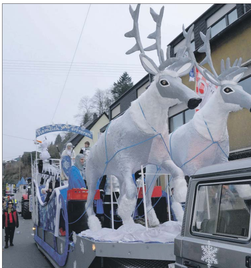
Stammgäste. Beim Biewerer Schärensprung sind immer wieder Karnevalsclubs aus den Nachbarorten mit dabei. 2015 hatten die Neweler einen arktisch angehauchten Motivwagen vorbereitet.

Weitere Infos, auch zu den nicht angesteuerten Stationen und weiteren Ersatzhaltestellen, im Internet ( www.swt.de ) sowie im Servicecenter. red