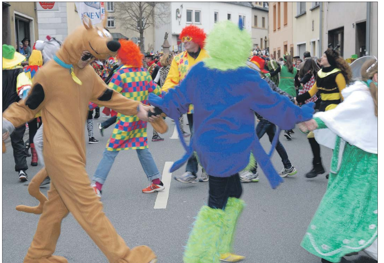
Kreuz und quer. Beim traditionsreichen Schärensprung in Biewer hüpfen die Narren über die gesperrte Hauptstraße des Trierer Stadtteils.

oder sie kreuzenden Straßen sind ab etwa 11.30 Uhr gesperrt. Die Zugteilnehmer können den Aufstellungsraum nur über die Bundesstraße 268 erreichen.