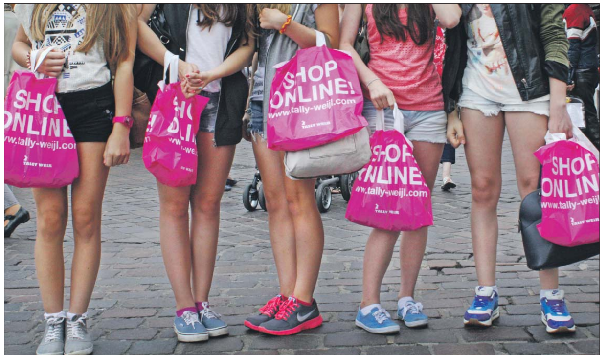
Shoppen ist schön. Nicht nur das überdurchschnittliche Warenangebot lockt Kunden bis weit aus der Nordeifel, dem Saarland und Luxemburg ins Oberzentrum Trier. In kaum einer anderen Stadt lässt es sich so entspannt bei einem Bummel durch die Fußgängerzone und die angrenzenden Straßen einkaufen, relaxen und schlemmen. Immer mehr Einzelhändler setzen auf ein zweites Standbein und bieten Waren online an.

Nach Warengruppen differenziert zeigt sich, dass die innenstädtischen Kernsortimente des „persönlichen Bedarfs“, im Segment „Medien und Technik“ sowie die Hauptwarengruppen „Spiel, Sport, Hobby“ und „Geschenke, Glas, Porzellan, Keramik, Hausrat“ im Stadtgebiet von Trier 41,8 Prozent der Verkaufsflächen belegen und 45,9 Prozent des gesamtstädtischen Umsatzvolumens ausmachen. Besondere Kernkompetenz hat der Trierer Einzelhandel in der Warengruppe „Bekleidung, Wäsche“. Mit über 73.000 Quadratmetern Verkaufs-