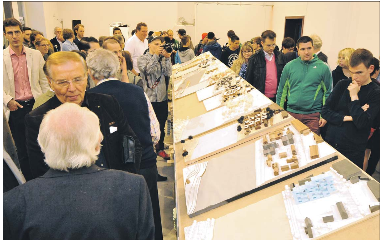
Schräglage. Um den zahlreichen Besuchern im Posthof das Betrachten und Vergleichen der Studentenmodelle zu erleichtern, haben die Ausstellungsmacher sie auf schräg gestellten Pulten befestigt.

Vor der Entwurfsphase für die künftige Bebauung nahmen die Studenten eine Bestandsaufnahme in Angriff. Das „Field Mapping“ widmete sich den Verkehrs- und Sozialstrukturen des Geländes sowie seines Umfelds in der Beziehung zur Innenstadt, aber auch dem Night Life und der Versorgungsinfrastruktur. Die Gestaltungsvisionen für das Gelände mussten sich an drei Vorgaben und Herausforderungen messen lassen: optimale Orientierung für möglichst alle Wohneinheiten, Individualisierung versus Gemeinschaftsbildung sowie eine „maxi-