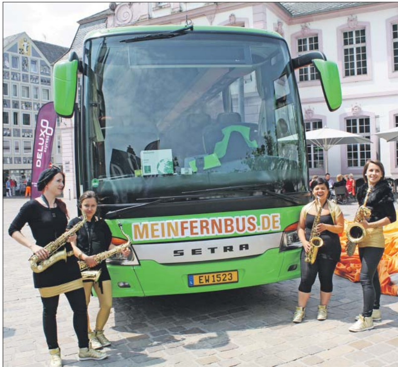
Tusch! Die Gruppe „Famdüsax“ wirbt auf dem Domfreihof für den neuen DeLux-Express in Grün. Ab Juli fährt der Fernbus im Verbund.

Zum Start findet in der Stadtbibliothek am Dienstag, 25. Juni, 11 Uhr, ein „Buchcasting“ statt. Dabei küren 15 Schüler vom FWG aus einer Auswahl der neuen Jugendromane Sieger in verschiedenen Sparten und können direkt einige Neuzugänge kennenlernen.