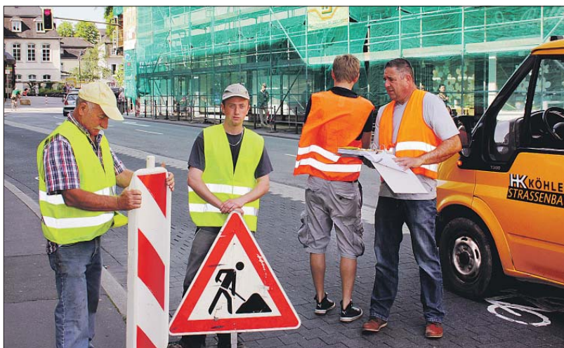
Mitarbeiter der Firma Köhler Straßenbau und der Stadt stellen am Montag im Margaretengäßchen die Beschilderung für die Baustelle an der Trevirispassage auf. Dort beginnen nach monatelanger Sperrung jetzt die Arbeiten zur Erneuerung der Bustrasse und Haltestellen.