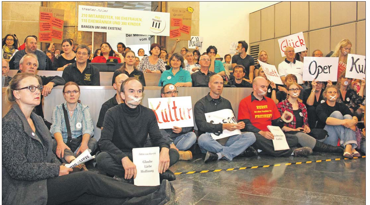
Beredter Protest. Mehr als 100 Mitarbeiter aller Sparten des Theaters protestieren stumm gegen die Kürzungspläne während der Kulturausschusssitzung.

Bei dieser Variante werden die Musik- und Tanzensembles durch Gastspieler ersetzt, das Orchester wird beibehalten, muss sich neu als Konzertorchester profilieren und seine Gastspieltätigkeit ausbauen. Es entfallen durchschnittlich acht Neuinszenierungen (sechs Musiktheater, zwei Tanz) und eine Wiederaufnahme mit insgesamt