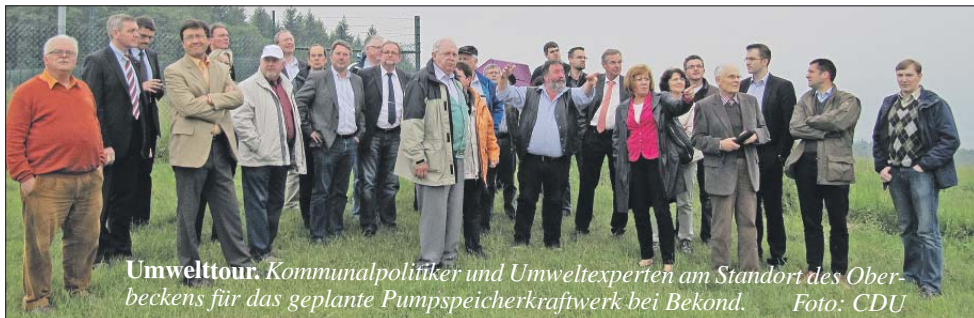
Umwelttour: Kommunalpolitiker und Umweltexperten am Standort des Oberbeckens für das geplante Pumpspeicherkraftwerk bei Bekond.