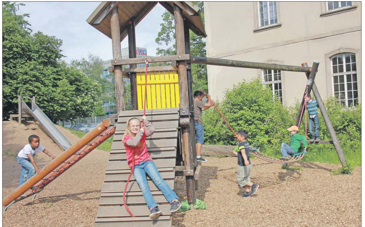
Bunte Mischung. In der innenstadtnahen Ausonius-Grundschule treffen sich in der Pause Kinder aus zahlreichen Nationen auf dem Spielplatz.