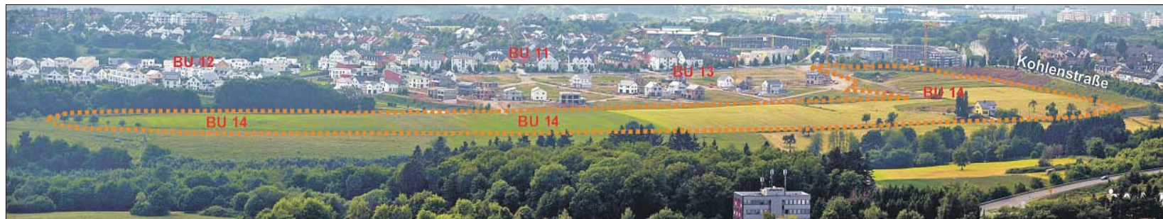
Abrundung. Das Baugebiet BU 14 „Ober der Herrnwiese“ bildet den östlichen Abschluss der städtebaulichen Erweiterung der Tarforster Höhe. Im Baugebiet BU 11 waren die ersten Familien im Jahr 2000 eingezogen. Die Panorama-Aufnahme entstand von der Korlinger Höhe aus.

Bürgerinformation zum neuen Baugebiet BU 14 in Filsch am 20. Juni