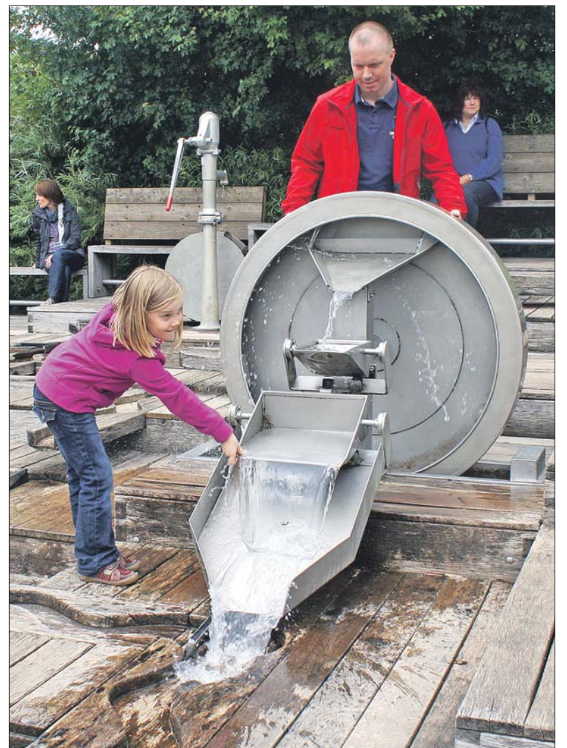
Spiel mit Elementen. Der Wasserspielplatz am Petrisberg kann als Abenteuerraum beschrieben werden. Die Kreativität der Kinder soll durch den gestalt- und veränderbaren Raum gefördert werden.

Nur in Ausnahmefällen wird davon wie etwa in Biewer als Straßendorf (Straße als Erlebnisraum) oder in Irsch mit viel Grünfläche abgesehen. Dort fallen Spiellücken nicht so stark ins Gewicht wie etwa in der dicht bebauten Altstadt.