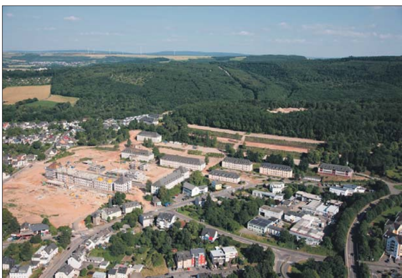
Die Nachbarschaft des neuen Wohngebiets in Feyen zum Naturschutzgebiet Mattheiser Wald (Foto) steht im Mittelpunkt des nächsten Castelnau-Gesprächs am Donnerstag, 29. August, 18 Uhr, im EGP-Gebäude, Albert-Camus-Allee 1. Im Rahmen einer Präsentation wird das Forstamt Trier das Spannungsfeld zwischen dem Flora-Fauna-Lebensraum und der Naherholung erläutern. Vorab gibt es einen Überblick über den Stand der Entwicklung des Stadtquartiers Castelnau.