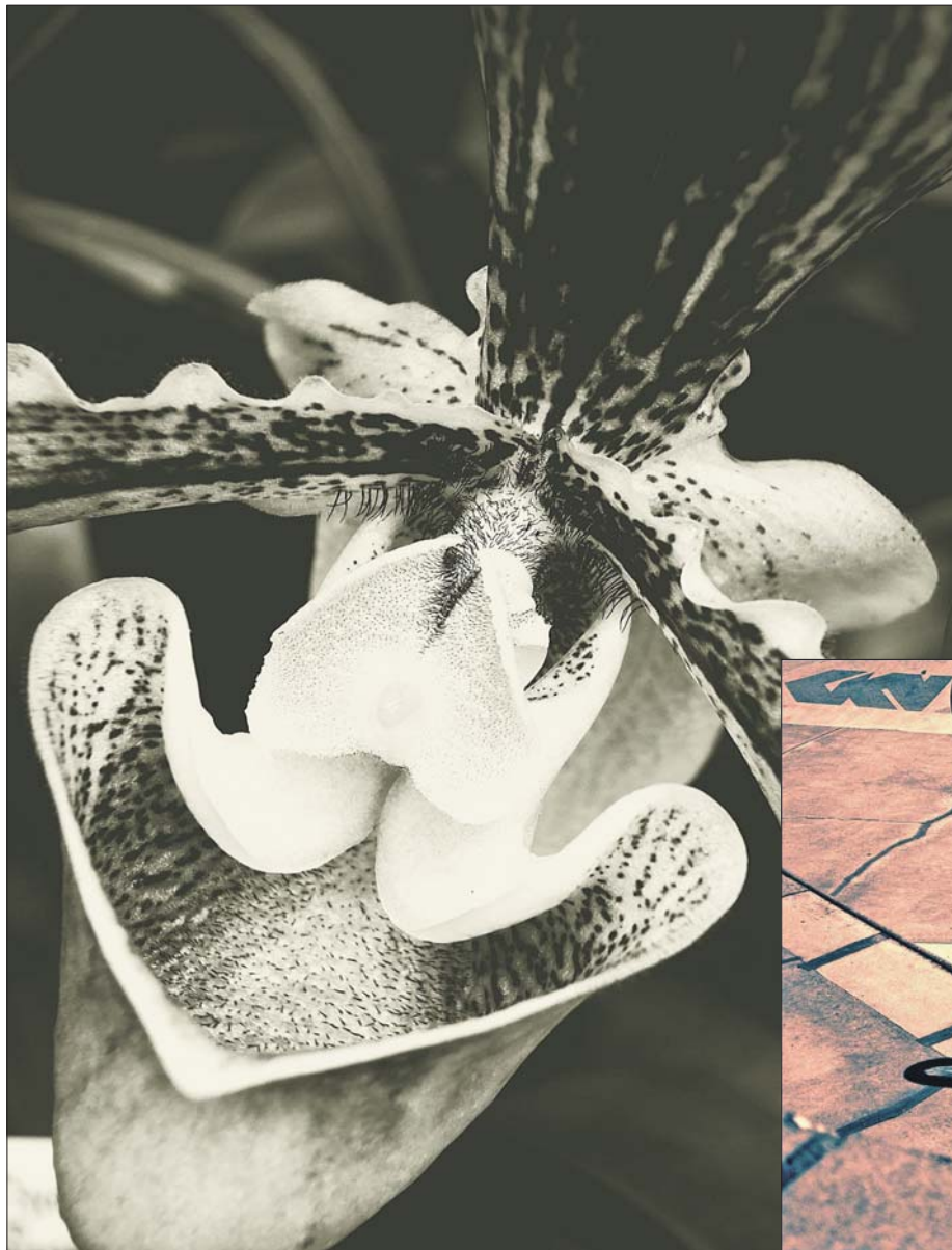
Ausgesuchte Fotografien des Künstlers Christoph Ehleben zeigt die Deutsche Richterakademie vom 22. August bis 18. Oktober: „Werkschau“ heißt die Ausstellung des in Hannover lebenden Fotografen. Vorwiegend Schwarz-Weiß-Bilder aus seinen früheren Schaffensperioden sind ausgestellt, aber auch neue Fotos aus seinen Serien über Hobbyfußball oder Freestyle-Fahrradfahren. Zu sehen sind sie Dienstag bis Freitag von 9 bis 16.30 Uhr. Die Ausstellung wird eröffnet am 22. August, 19.30 Uhr.

Änderungen vorbehalten Alle Angaben ohne Gewähr Stand: 15. August 2013