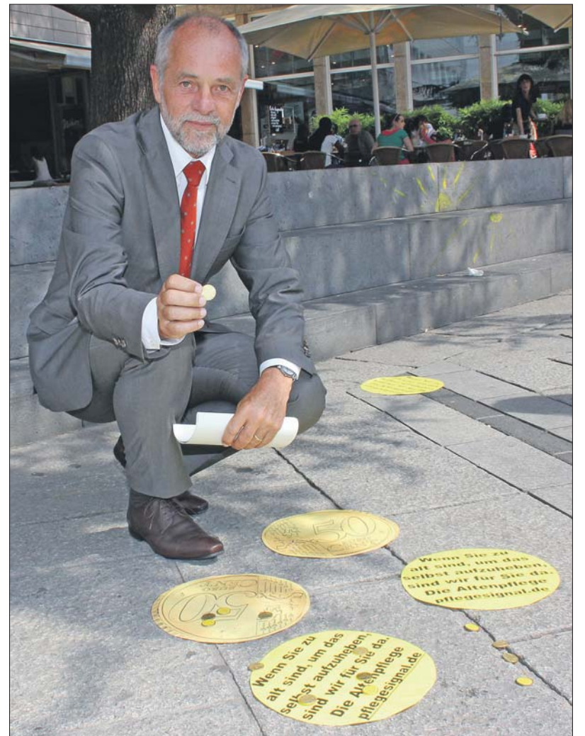
Sondermünze. OB Klaus Jensen präsentiert die „Pflegesignal“-Münze im Original und in einer vergrößerten Variante auf dem Kornmarkt.

Jensen beklagte die Unterbezahlung vieler Mitarbeiter: „Oft wird die Instandhaltung eines Autos viel besser entlohnt als die Pflege eines Menschen.“ Zudem müssten die Bedingungen so verbessert werden, dass im