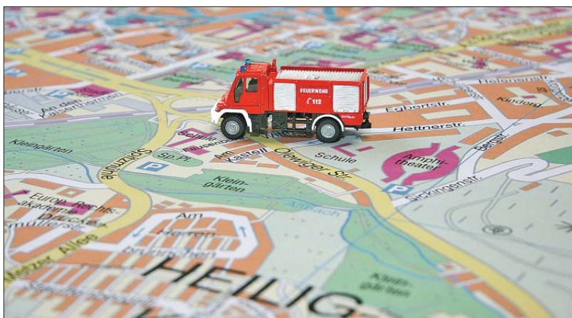
Planspiel. Gesucht wird ein neuer Standort für die Fahrzeuge und die Leitstelle der Berufsfeuerwehr.