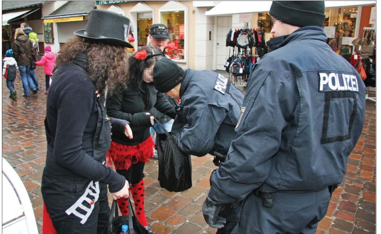
Sicherheit geht vor. Taschenkontrollen der Polizei an den Zugängen zum Hauptmarkt sind auch an Weiberfastnacht 2014 geplant. Dadurch wird verhindert, dass es zu Verletzungen durch Glasbruch kommt.

Weiberfastnacht 2014 erneut mit Alkoholverbot, aber geschützter Ausschankzone