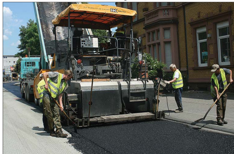
Frischer Belag. Im Juni wurde die Fahrbahndecke im Bereich Barbara-Ufer/Römerbrücke erneuert.

„Die Mittel werden so eingesetzt, dass man mit dem geringsten finanziellen Aufwand größtmögliche Instandsetzung erreichen kann“, betonte Kaes-Torchiani. Je früher mit der Erhaltung einer Straße begonnen werde, desto weniger Gelder würden für die Sanierung benötigt. Es sei unbedingt erforderlich, die Fahrbahndecken zu erneuern, bevor die Schäden in die unteren Straßenschichten gelangten und eine Sanierung verteuerten. Die Stadt spare umso mehr Geld, je besser sie das Verkehrsnetz auf ihrem Gebiet unterhalte.