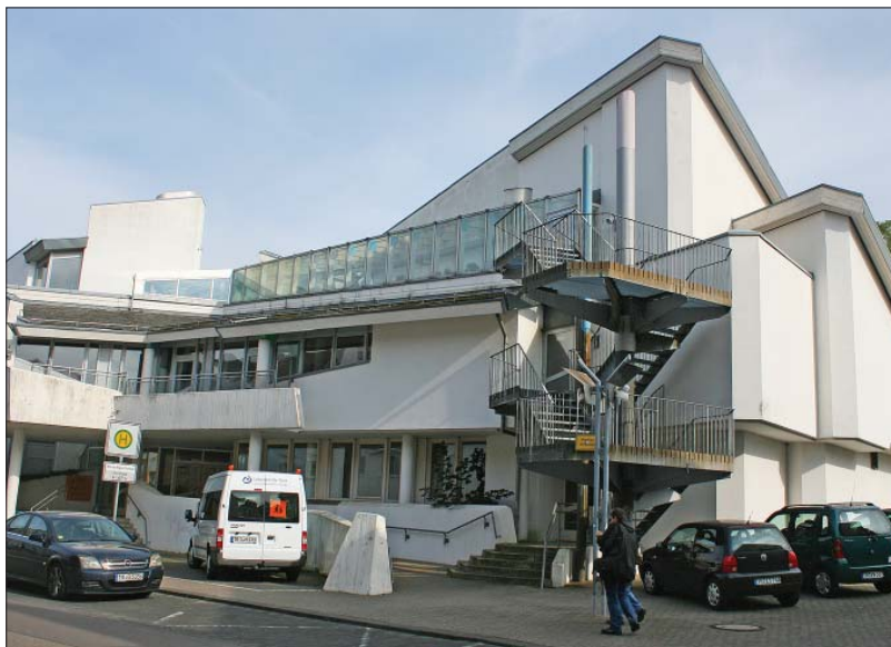
Lebenshilfe-Komplex. Die Porta Nigra-Schule an der Engelstraße in Trier-Nord liegt in einem Gebäude der Trierer Lebenshilfe. Das Grundstück reicht bis an die Paulinstraße heran.

Der erste Abschnitt der Schwimmbadsanierung ist für Januar/Februar 2014 vorgesehen, der zweite dann in den Sommerferien. Demnächst muss außerdem die Fassade des Schulgebäudes in der Engelstraße instandgesetzt werden.