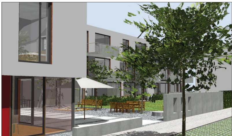
Vorzeigeprojekt. Die Beutelweg-Genossenschaft plant in Trier-Nord ein behindertengerechtes Gebäude mit breiten Zugängen sowie einem verglasten Gemeinschaftsraum. Entwurf: Ursula Komes, Planungsgruppe Wohnstadt, Aachen

Inklusion setze voraus, Wohnraum so zu schaffen, dass eine grundsätzliche Barrierefreiheit von Anfang an vorhanden ist. Es solle geprüft werden, ob durch Ausweisung besonderer Flächen grundsätzlich eine Bauweise gefördert wird, egal ob für bestehende oder geplante Projekte, die barrierearme Wohnungen ermöglicht. Als positives Beispiel nannte Poser die geplante Anlage der Wohnungsbaugenossenschaft Beutelweg in der Thyrusstraße: „Solche Projekte schaffen einen allgemeinen Wohnungsmarkt, der künftig auch behinderten Menschen zugänglich ist.“