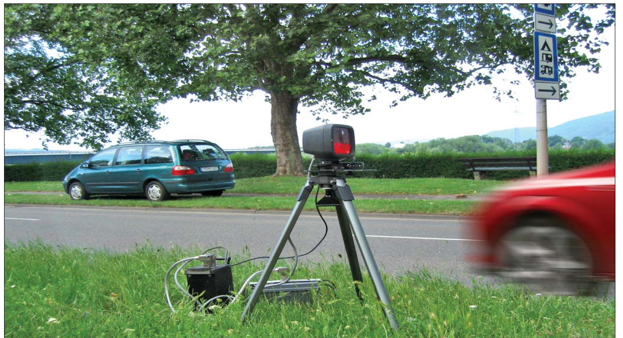
Erwischt. Noch kontrolliert in Trier die Polizei die Einhaltung der vorgeschriebenen Höchstgeschwindigkeiten. Geplant ist, die Zuständigkeit auf die Stadt zu übertragen und kommunale Blitzer einzurichten.

werden, damit im Echt-Einsatz fehlerfreie und gerichts-feste Daten gewonnen werden. Das Rathaus werde den Einsatz eines mobilen Messgerätes vorschlagen. Die Verwendung fest montierter Anlagen hänge von der Zustimmung des Innenministeriums ab und sei zur Zeit nicht absehbar.