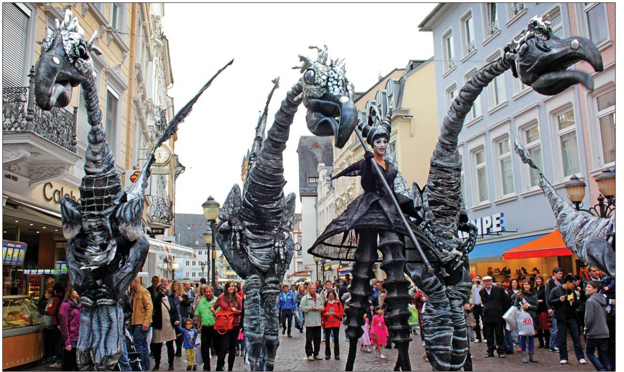
Hünenhaft. Eine fantastische Figurenshow mit Dinosauriern (Bild oben) und skurrilen Fabelwesen präsentierte die niederländische Gruppe „Close Act“ in der Simeonstraße.

Vier riesige, silbergraue Dinosaurier überragten selbst die Stelzenläufer um das Doppelte. Mit dumpfem Gebrüll stampften sie durch die Menge, die kreischend aus dem Weg ging. Viel Arbeit für die elegante Herrin der langhalsigen Urzeittiere, die mit einem langen schwarzen Stab die furchteinflößenden Viecher dressierte. Sie schafften es auch bis zum Hauptmarkt. Dort verbeugten sie sich brav vor ihrer gehörnten Meisterin. Dann ging es zurück, nicht ohne den ein