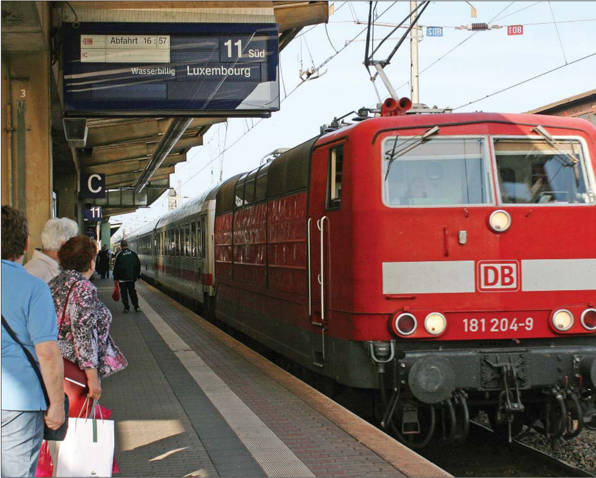
IC-Station Trier. Zweimal täglich hält derzeit noch ein Fernzug im Trierer Hauptbahnhof. So ist eine umsteigefreie Verbindung aus Düsseldorf, dem Ruhrgebiet und weiter nach Luxemburg möglich.

Stadtrat protestiert gegen Pläne zur Streichung der Fernzüge von und nach Trier