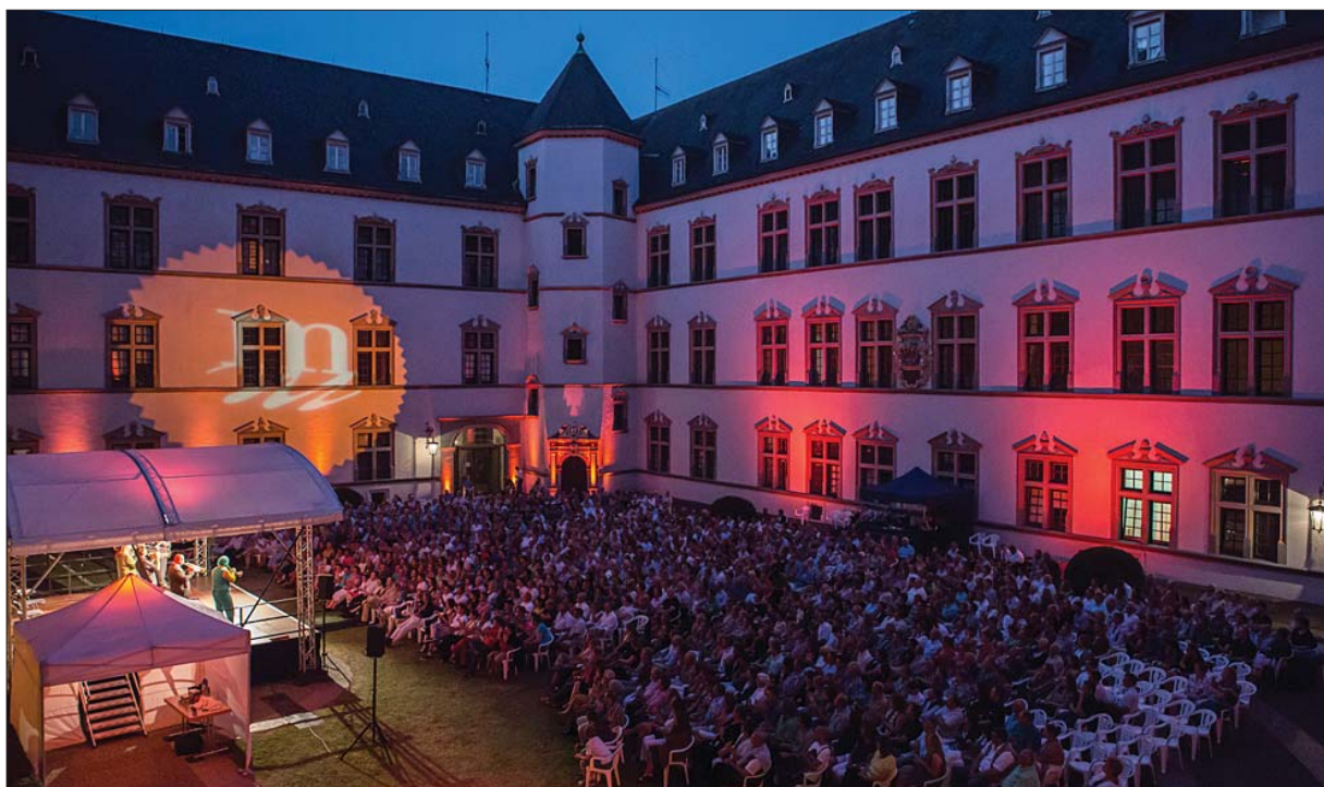
Geburtstagsparty. Ein Höhepunkt des Sommerprogramms war das Konzert „Happy Birthday Mnozil Brass“ zum 20. Geburtstag des Ensembles im festlich erleuchteten Innenhof des Kurfürstlichen Palais.

Zu den Höhepunkten gehörte nach Aussage von Festivalintendant Hermann Lewen das Geburtstagskonzert „20 Jahre Mnozil Brass“ in Trier. „Flying Bach“ war mit 2700 Besuchern das weltweit am besten besuchte Gastspiel der Tournee. „Der Trend, dass das Mosel Musikfestival auch überregional touristisch wahrgenommen wird, hat sich positiv weiterent-