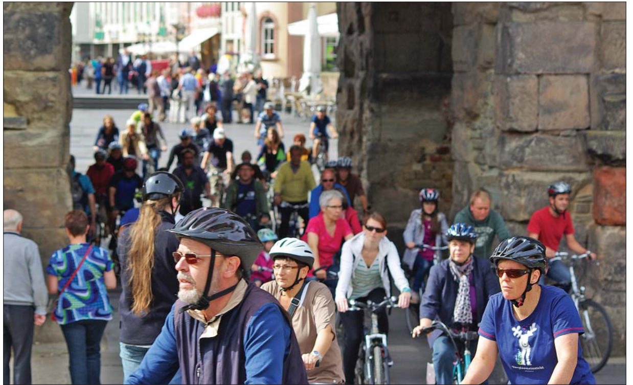
Stadttorradler. Rund 50 Teilnehmer starteten am 1. September an der Porta Nigra zur gemeinsamen Auftaktrunde. Es folgten noch knapp 100.000 Kilometer.

Das Ehepaar Dache fuhr im Team Theater, das zum ersten Mal am Stadtradeln teilnahm. Die Organisatoren im Rathaus, Umweltberater Johannes Hill und Toni Loosen-Bach, Koordinator für Bürgerbeteiligung, bedankten sich nach Abschluss der Aktion bei allen Teilnehmern und Teamkapitänen: „Trotz nicht immer optimalen Wetters hat sich die Zahl der Teilnehmer und Teams gegenüber dem ersten Jahr erhöht und es kamen fast nur positive Rückmeldungen. Ideen und Anregungen zum