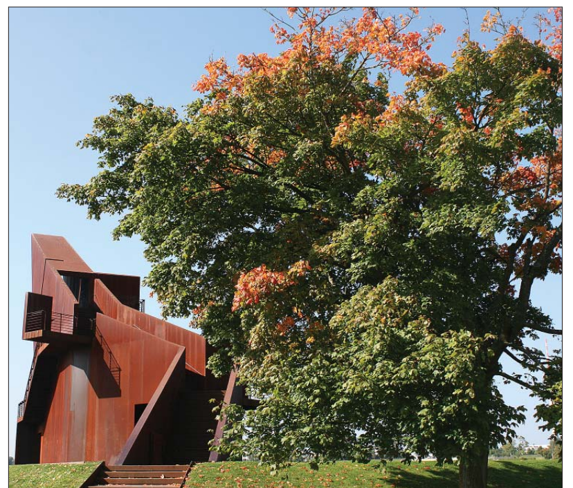
In der strahlenden Herbstsonne Anfang Oktober kommt der bewusst dem Rost ausgesetzte Turm Luxemburg genauso gut zur Geltung wie die bunt gefärbten Blätter des benachbarten Baums im Petrispark.