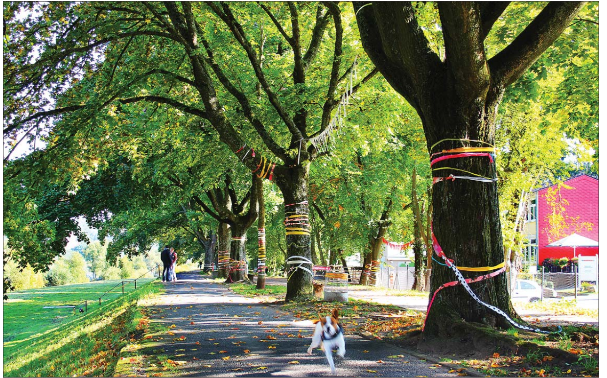
Licht und Schatten. Die prächtigen Bäume am Moseluferweg in Trier-Nord bleiben bei Umsetzung des neuen Gestaltungskonzepts erhalten. Die Promenade ist aber stark sanierungsbedürftig.

Stadtrat beschließt beispielhaftes Konzept zur Aufwertung eines Moseluferabschnitts