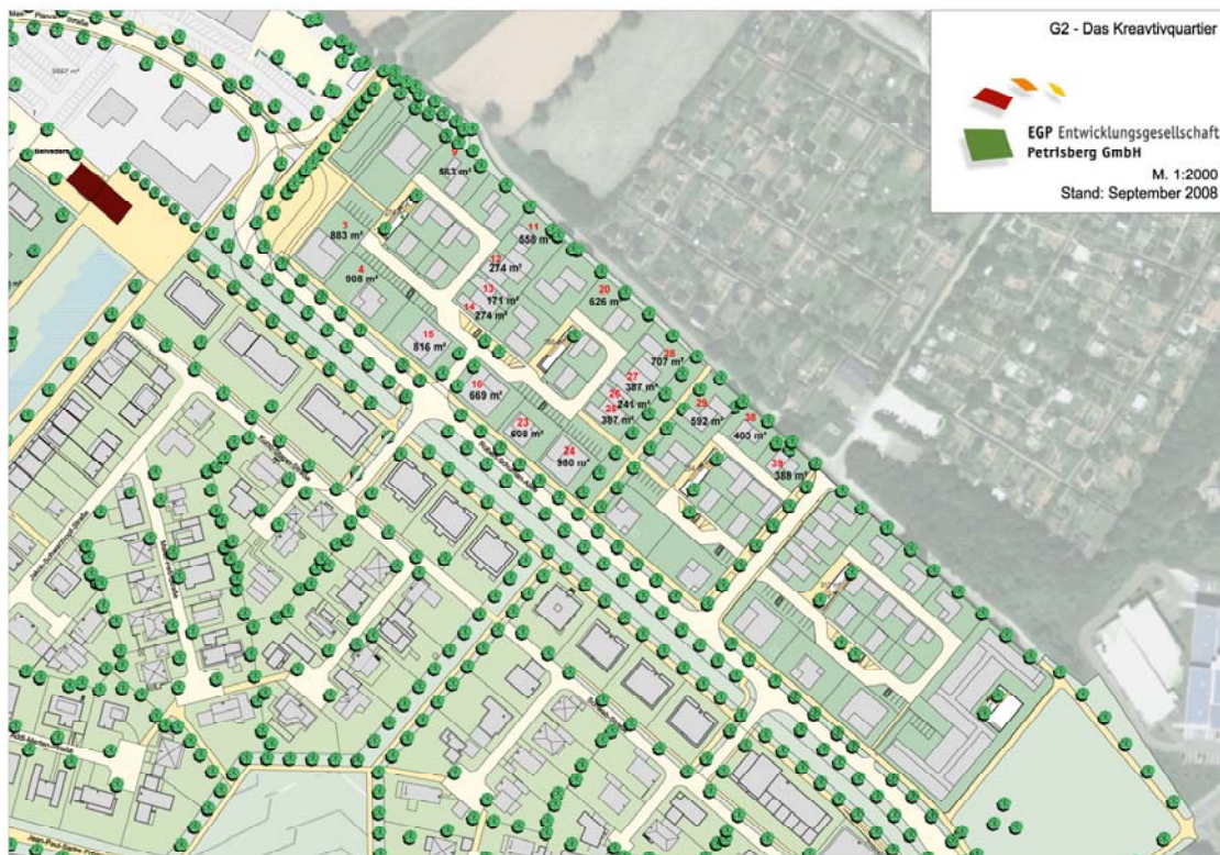
Abb. städtebauliches Konzept BU 16-1

Vielfältige Fußwegebeziehungen ermöglichen eine Vernetzung der unterschiedlichen Hofbereiche und führen hinaus in den umgebenden Landschaftsraum.